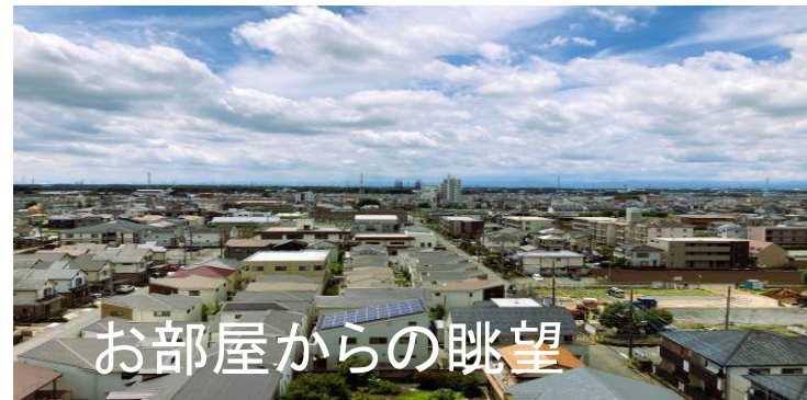
お部屋からの眺望